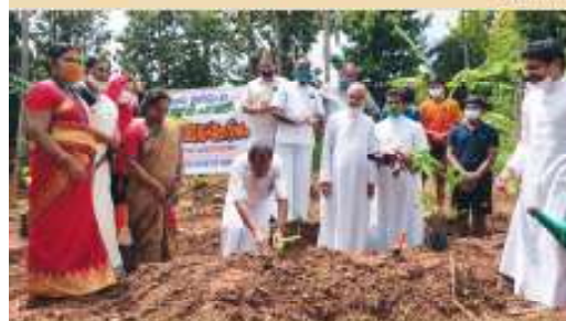
Model plot at Minor Seminary Thrikkakara