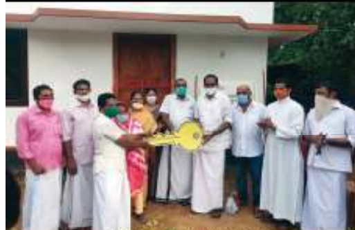
Key Handing Over Program Al Paravur