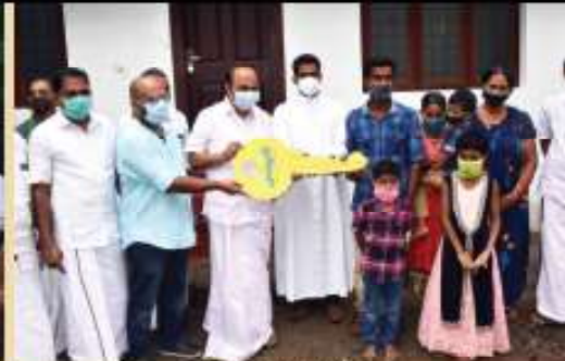
Key handing over al Alava