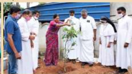
Planting tree at Kadavunilira in connection with Florithasantraiy program