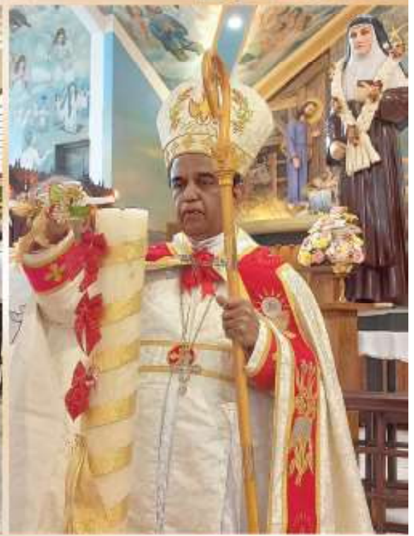
അതിരൂപത ശക്തോത്തര രജതജൂബിലി ഉദ്ഘാടനം